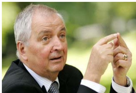
Seit vielen Jahren ist Klaus Töpfer ein Anwalt der geschundenen Natur – und der Menschen, die heute schon unter Umweltproblemen zu leiden haben.